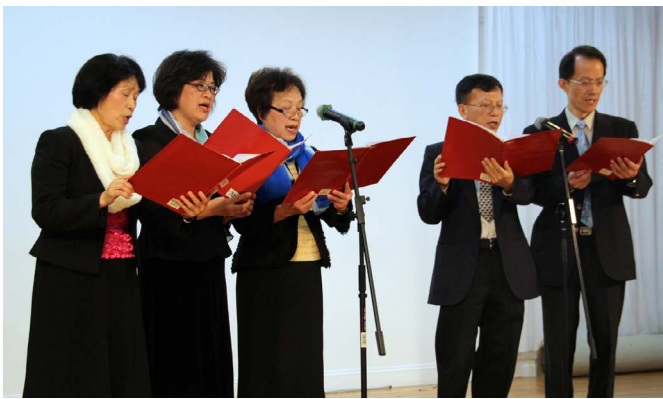
紐約聖教會小詩班