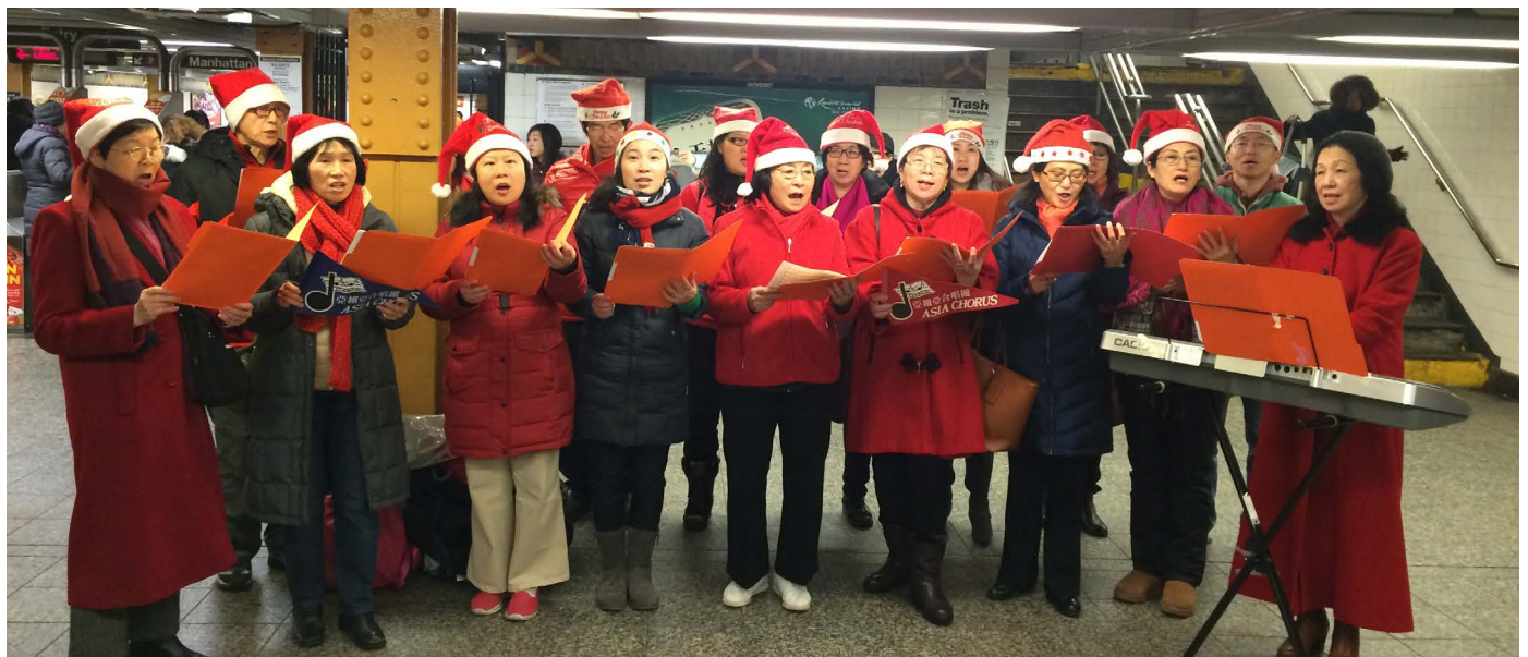
台灣會館亞細亞合唱街頭巷尾報佳音於 12 月 20 日前往法拉盛緬街的 7 號地車車站「報佳音」，優美的合聲演唱平安夜、普世歡騰、天使歌唱在高天、恭祝你們聖誕快樂等歌曲，讓來往車站的民眾不知不覺停下腳步聆聽聖歌，許多民眾表示感到受節日的歡樂與祝福，臉上都掛著歡喜笑臉並向唱詩班表示感謝。