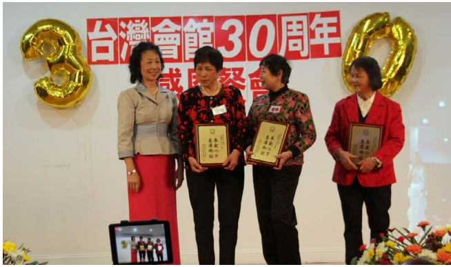
特別頒獎 _ 台灣會館義工服務超過 15 年