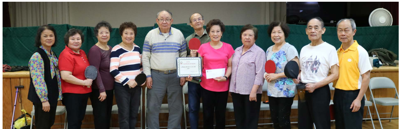
頒獎 _ 第一名