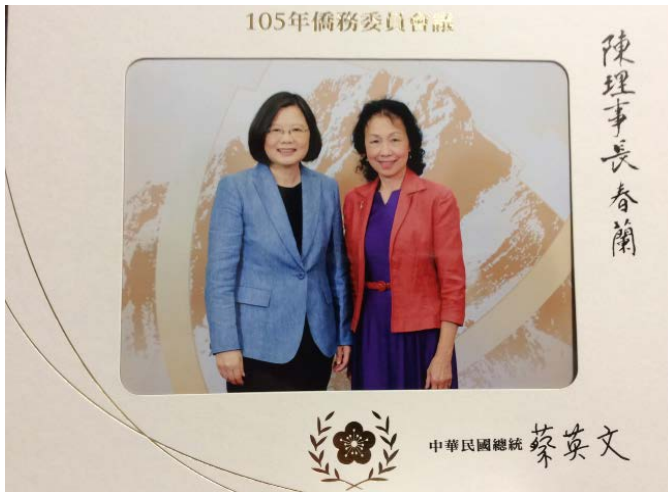
10_23_2016 陳春蘭理事長應邀回台灣參加僑務委員會會談與蔡英文總統合影