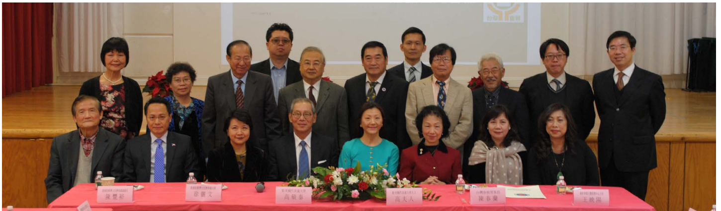
12_3_2016 台灣駐美國代表高碩泰大使拜訪台灣會館與社團代表合影。