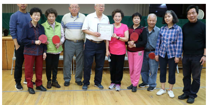
頒獎 _ 第三名