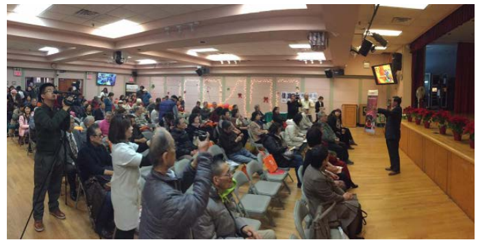
現場名眾出席踴躍