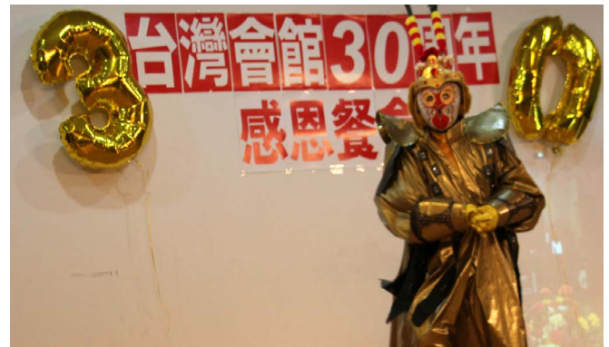
魔術師李鵬 _ 孫悟空變臉