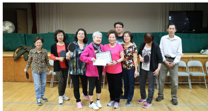
頒獎 _ 第二名