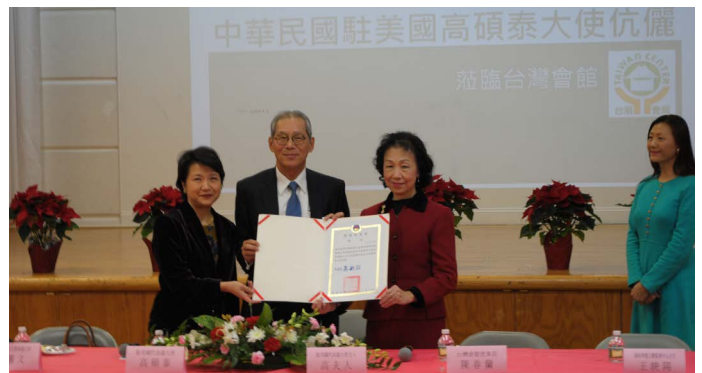
高碩泰大使、徐儷文大使代表僑委會委員長吳新興向臺灣會館頒發表揚獎狀